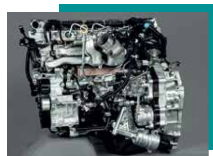
Motor 4JZ1-TCS >>>

Nuevo motor de alta tecnología que cuenta con 150 Caballos de potencia y 38 Kg-m de Torque, permite ahora el cambio de aceite hasta 40.000 Km, lo que genera un ahorro en los mantenimientos preventivos, aumentando la rentabilidad de tu negocio.