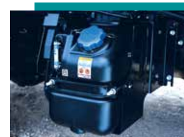
Sistema de Postratamiento >>>

Cuenta con una capacidad de carga de 2.420 kg y una distancia entre ejes de 2.750 mm, ideal para aplicaciones de carga en volumen. Maximizando la rentabilidad de su negocio.