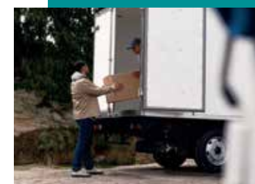
Capacidad de Carga >>>

Sistema de ajuste de tiempo en el eje de levas de escape reduciendo el tiempo en alcanzar la temperatura adecuada y reducir emisiones contaminantes.