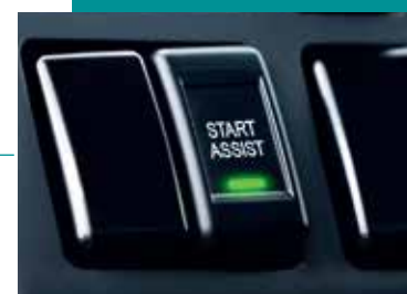
Sistema de Asistencia de Arranque >>>

Facilita el arranque del vehículo en superficies inclinadas, evitando el desgaste prematuro del embrague.