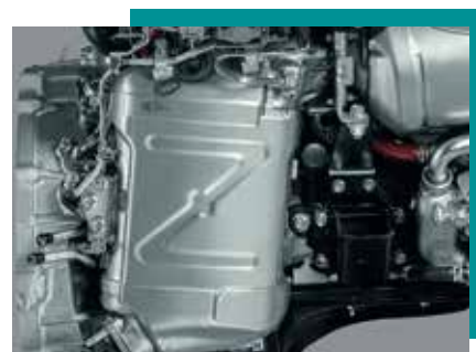
Filtro de Partículas DPD >>>

Nuevo motor de alta tecnología que cuenta con 150 Caballos de potencia y 38 Kg-m de Torque, permite ahora el cambio de aceite hasta 40.000 Km, lo que genera un ahorro en los mantenimientos preventivos, aumentando la rentabilidad de tu negocio.