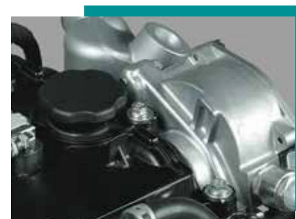
Variable Valve Timing >>>

La nueva tecnología I-ART, mejora la precisión y eficiencia de la inyección del combustible, con su memoria electrónica integrada al inyector que controla la presión del combustible.