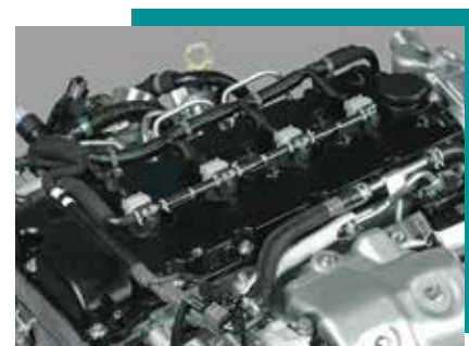
Sistema I-ART: >>>

Mejora la eficiencia de la regeneración y reduce la cantidad de hollín producido en el sistema.